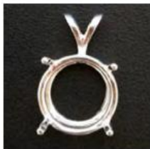
Anhänger 1 geteilte Schlaufe