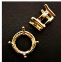
Anhänger 2 Fassung ohne Schlaufe