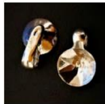
Anhänger 3 Rückseite geschlossen